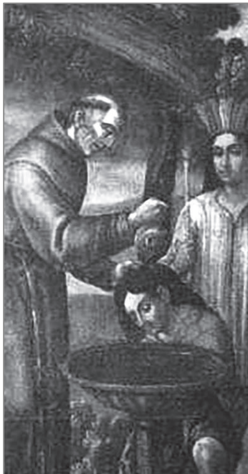
Figura 3 Fray Jodoco Rique Guardián de San Francisco

Cuando Núñez de Vela salió hacia la Gobernación de Popayán, dejó en Quito un escrito, fijado en el rollo, por el cual se declaraba traidores a quienes no le seguían.