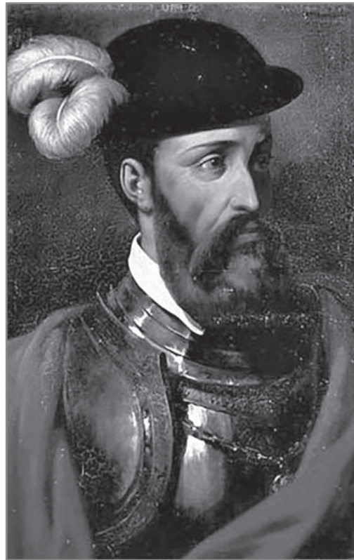
Figura 2 Gonzalo Pizarro Gobernador del Perú

Después de la entrada de Gonzalo Pizarro a Lima, los oidores le recibieron solemnemente como Gobernador del Perú y pusieron en sus manos el poder. Se presentaba, entonces, una nueva situación confusa, pues los colaboradores íntimos del Virrey se consideraban leales a la Corona o “realistas”, y los rebeldes a Blasco Núñez Vela, “gonzalistas”, con Pizarro al frente, también se proclamaban leales al Rey.