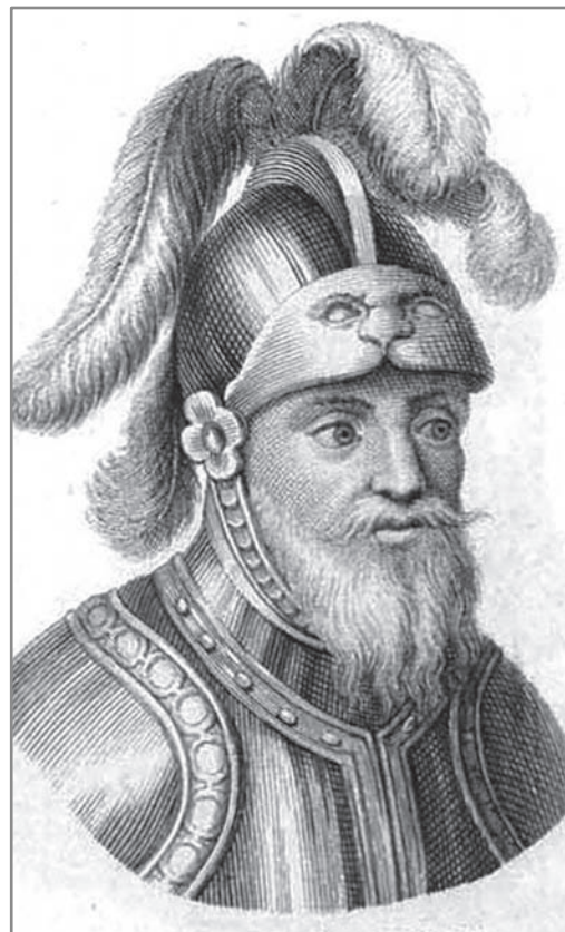
Figura 4 Sebastián de Benalcázar Gobernador de Popayán