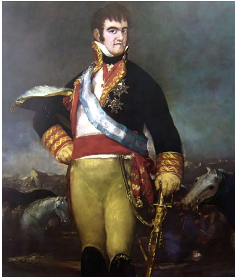
Retrato de Fernando VII por Goya, Museo del Prado, Madrid.