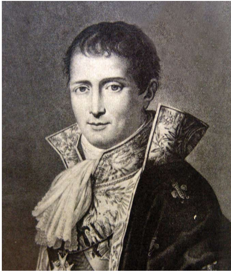
Retrato de José Bonaparte, llamado «Pepe Botellas», hermano de Napoleón impuesto como regente en España, luego de la abdicación de Carlos IV y la prisión de su hijo Fernando VII.