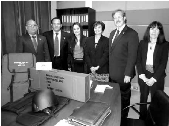
Programa de Acción Integral contra las Minas Antipersonal (AICMA-OEA) donación de equipos para Deaminado Humanitario. Funcionarios del Programa y de la Dirección de Relaciones Vecinales y Soberanías. Quito, 19 de junio de 2013.

En el mes de febrero de 2014, expertos del Centro Internacional de Desminado Humanitario (GICHD), realizarán en la ciudad de Quito, por primera vez, un curso de actualización del sistema IMSMA, el cual será dirigido a toda la Región.