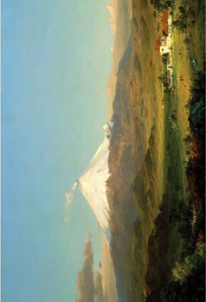
“Cotopaxi” Frederick Edwin Church, 1855.