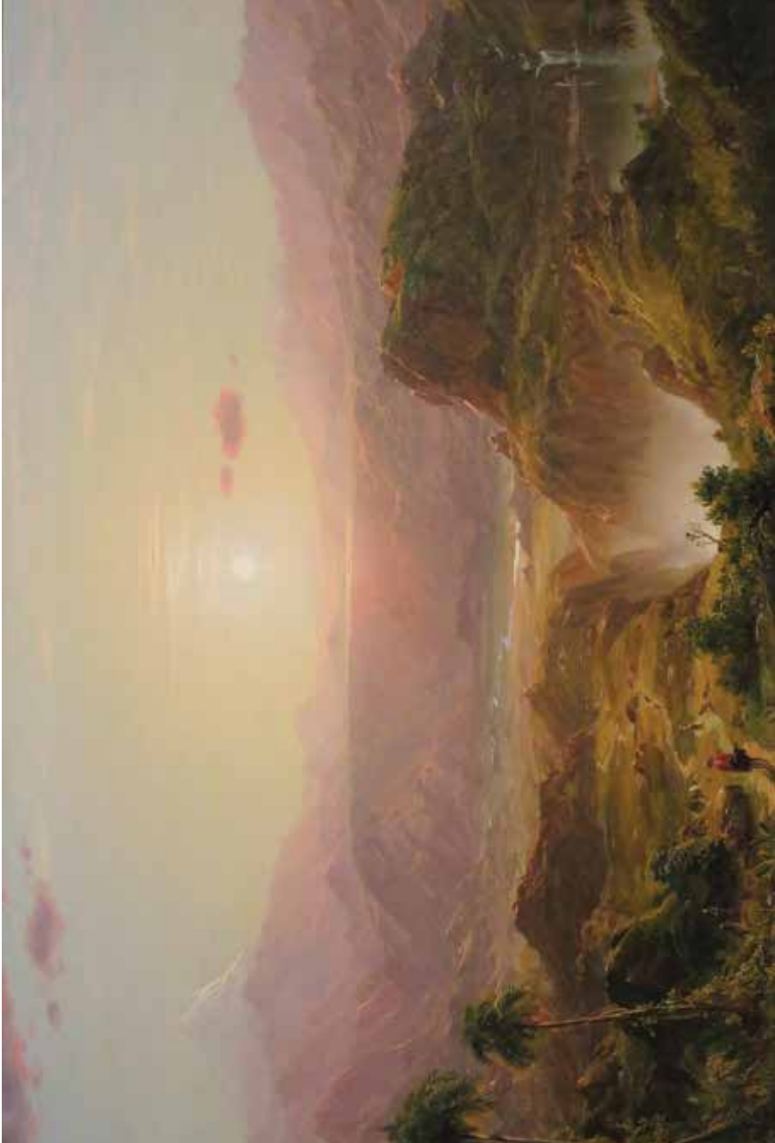
"The Andes of Ecuador" Frederick Edwin Church . c. 1855. Museo de Arte de Honolulu.