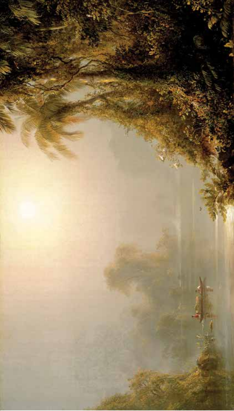
"Morning in the Tropics" Frederick Edwin Church. ca. 1858. Museo de Arte Walters.