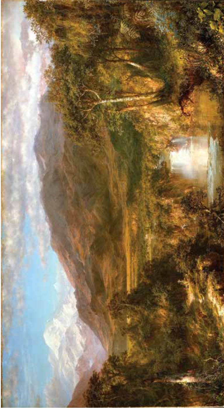
"The Heart of the Andes" Frederick Edwin Church. 1859. Museo Metropolitan de Arte, New York.