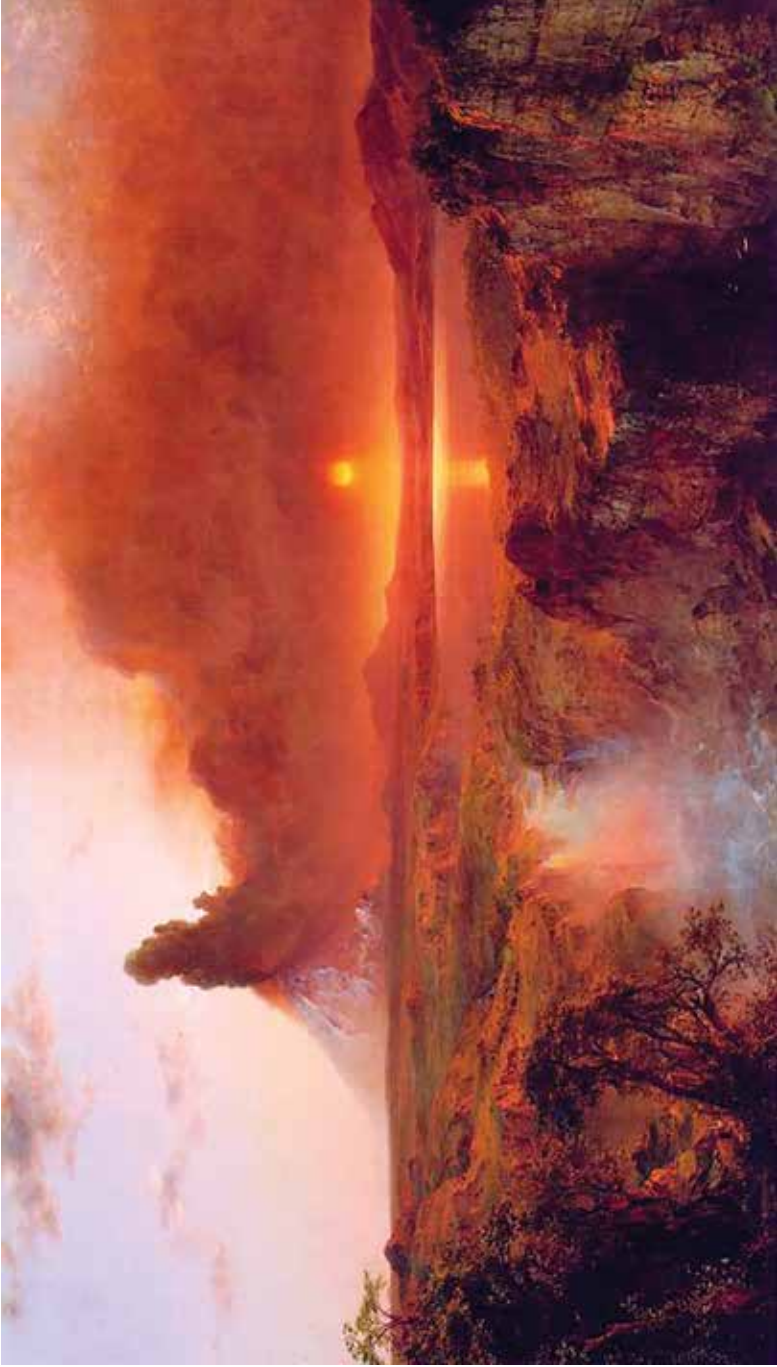
“Cotopaxi” Frederick Edwin Church, 1862. Instituto de Artes de Detroit.