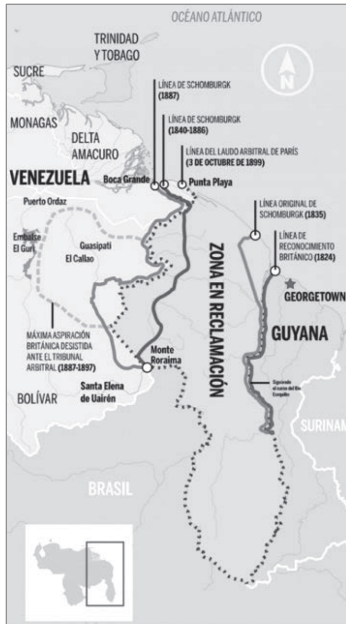
Figura 1

Este tema, que data de inicios de siglo XIX, es considerado por algunos países como una «herencia de la época colonial» que hasta ahora no puede